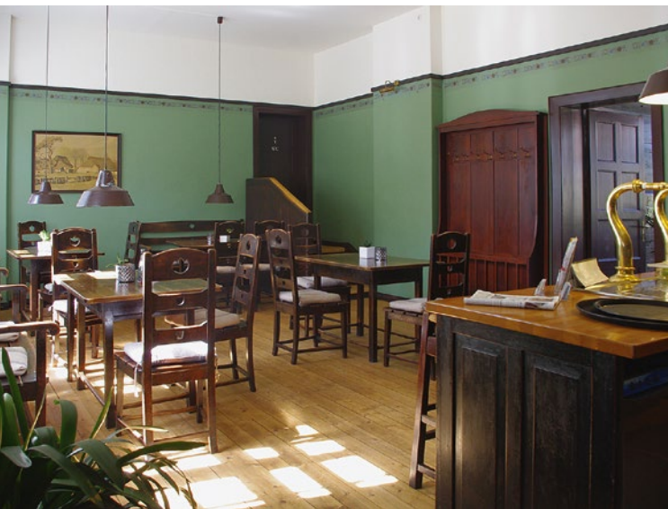
DIE DRITTE KLASSE