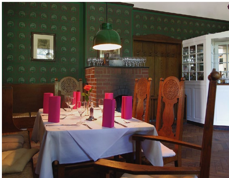
DIE ZWEITE KLASSE